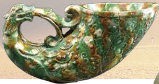
《鳳首杯》唐・8世紀/1982年西安市韓森寨出土 一級文物/陝西歷史博物館

開館時間：9:40~18:00(展示室入場は17:30まで) 休館日：6/24(月)、7/2(火)、8(月)、16(火)、22(月)、 29(月)、8/6(火)、13(火)、19(月)、26(月)