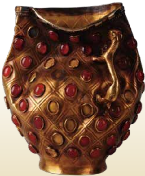
《瑪瑙象嵌杯》5-7世紀/1997年イリ州昭蘇県ボマ古墓出土 一級文物/イリ州博物館